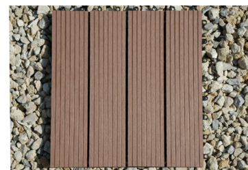
Coloris 1 : Médium Brown