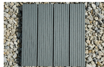
Coloris 2 : Stone Grey